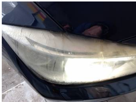
Phare avant droit (Rayure)